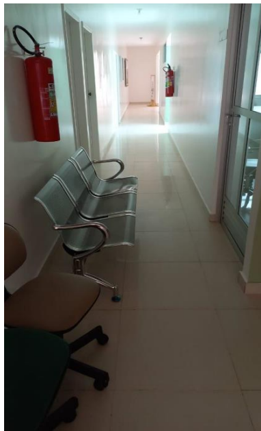
Imagem 04 – Corredor de acesso aos gabinetes