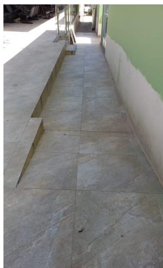
Imagem 06 – Acesso a rampa do auditório.

Ao fundo do prédio dos gabinetes deverá ser aplicada uma faixa de piso tátil que direcione os usuários da porta de saída até o início da rampa que dá acesso ao auditório e plenária da Casa.