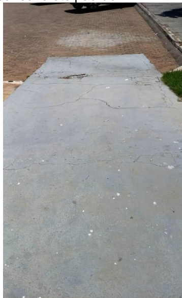
Imagem 01 – Rampa de acesso principal danificada e sem direcionamento tátil.

Devera ser aplicada pintura em tinta para piso sobre toda a área da rampa, na cor concreto padrão.