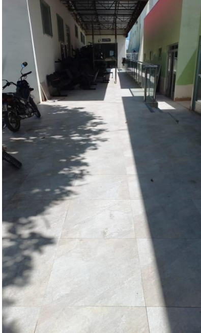
Imagem 07 – Rampa de acesso ao auditório.

Câmara Municipal de Guanambi CENTRO ADMINISTRATIVO CEP 46430-000 - ESTADO DA BAHIA