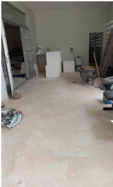
Imagem 08 – Hall de entrada do auditório.

Deverá ser instalada o piso tátil que direcione os usuários para o acesso ao auditório, aos banheiros e copa do auditório e identifiquem todas as mudanças de direção e portas do ambiente.