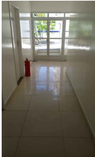
Imagem 05 – Corredor de acesso aos gabinetes com porta de saída para a rampa.