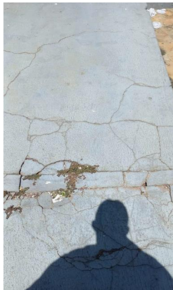
Imagem 02 – Rampa de acesso principal danificada e sem direcionamento tátil.