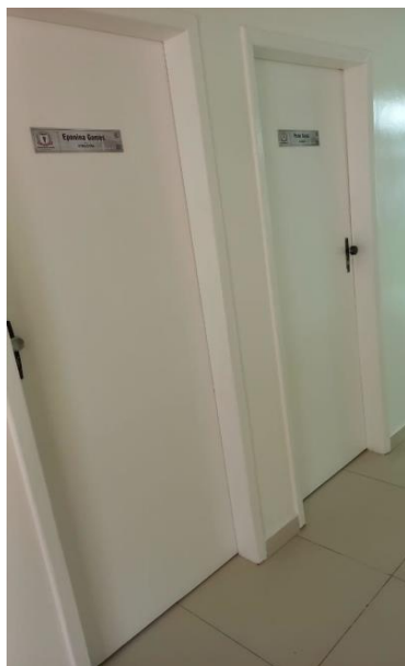
Imagem 12 – Portas sem identificação em braile.

No auditório, sala do presidente, e sala de reunião deverá ser instalada uma placa com 25x15 cm de dimensões. Nas demais salas, banheiros e acessos, deverá ser instaladas 27 placas com dimensões iguais a 28x8 cm.